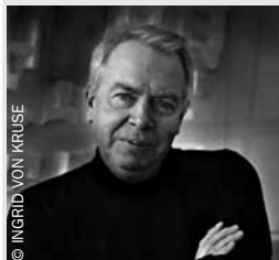
DAVID CHIPPERFIELD ARCHITECTS

David Chipperfield Architects è stato fondato nel 1984 e ha uffici a Londra, Berlino, Milano e Shanghai. Lo studio lavora a livello internazionale spazia tra progetti culturali, residenziali e commerciali occupandosi di architettura, interior design, masterplanning, servizi di progettazione, di design di arredi, sia per il settore pubblico che privato. Lo studio ha vinto numerosi premi e concorsi nazionali e internazionali, è stato menzionato per l'eccellenza nel design, tra cui i premi RIBA e AIA, così come lo Stirling Prize nel 2007. Il lavoro di David Chipperfield Architects è guidato da un approccio filosofico coerente che conduce alla creazione di singoli edifici che sono intimamente connessi con il contesto e la funzione.