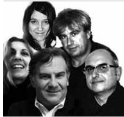
GENIUS LOCI ARCHITETTURA